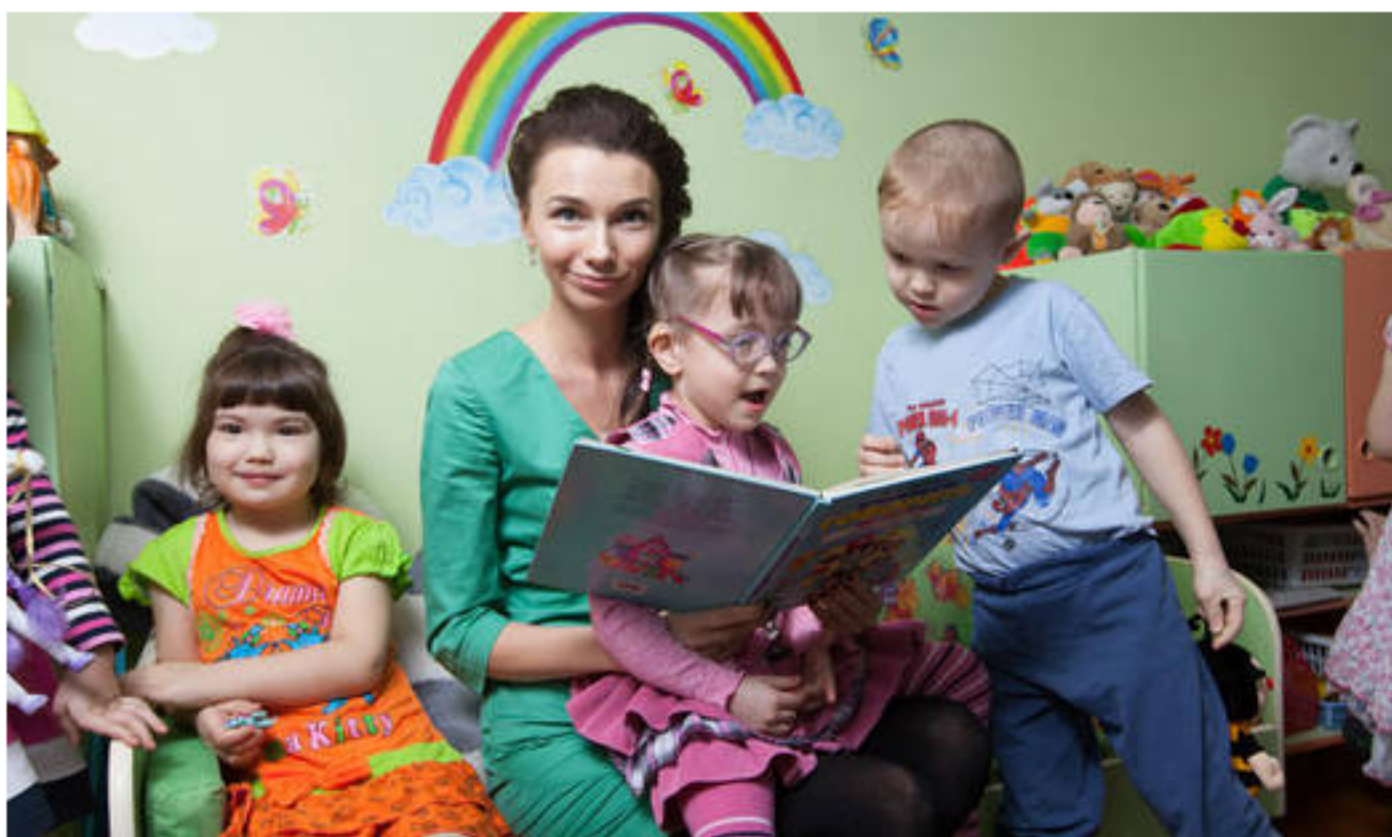
Благотворительный фонд «Подари ЗАВТРА!» помогает детям-инвалидам Удмуртии

Отрывая новую рубрику, «Удмуртская правда» начинает серию публикаций о людях, которые изо дня в день меняют нашу жизнь к лучшему.